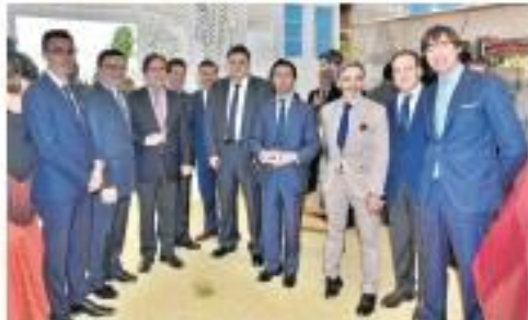
Recepción institucional de Cesur, Asociación de Empresarios del Sur de España, en el Real de la Feria.