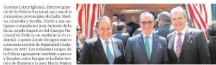
Germán López Iglesias, director general de la Policía Nacional, con otros miembros del cuerpo de la Guardia Civil y de la Policía Nacional en la caseta de la Policía