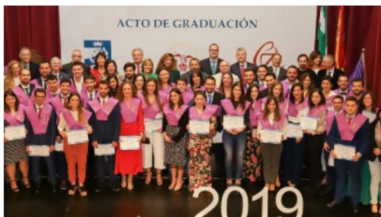
Acto de graduación de este año de la Escuela Politécnica Superior de la Universidad de Sevilla. COGITISE

Este estudio formará parte de la actualización de 'Diagnóstico de la situación de la Mujer en el sector TIC andaluz' que desarrolla WomANDigital para la Junta de Andalucía.