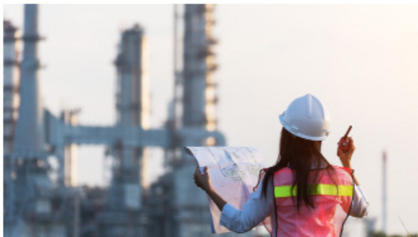
Más del 80% de las mujeres tituladas en Ingeniería Técnica Industrial tienen empleo.

• Su presencia es aún muy minoritaria en un sector donde la mayoría trabaja por cuenta ajena