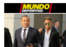
Reunión del padre de Neymar con la Juventus

El objetivo del estudio, según ha informado Cogitise en un comunicado, es analizar la situación laboral de sus colegiadas y ofrecer datos públicos sobre el perfil de la mujer ingeniera en la provincia de Sevilla.