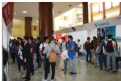
Encuentro sobre Ingeniería y Empleo en la Escuela Técnica Superior de encuestadas desempeña profesiones ajenas a este campo.

El Colegio Oficial de Graduados e Ingenieros Técnicos Industriales de Sevilla (Cogitise) ha realizado un estudio que muestra que la empleabilidad de las ingenieras técnicas industriales alcanza el 82,4%, y ha subrayado que el 97,2% de las colegiadas de Cogitise dedica o ha dedicado su carrera profesional al desarrollo de la ingeniería técnica industrial, mientras que solo 2,8% de las