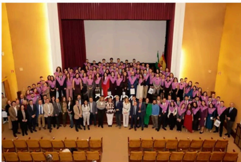
Más de cien nuevos ingenieros técnicos industriales celebran su graduación en la Escuela Politécnica - COGITISE

Lobato entrega el acta notarial y el móvil al juez del Supremo que investiga al fiscal general